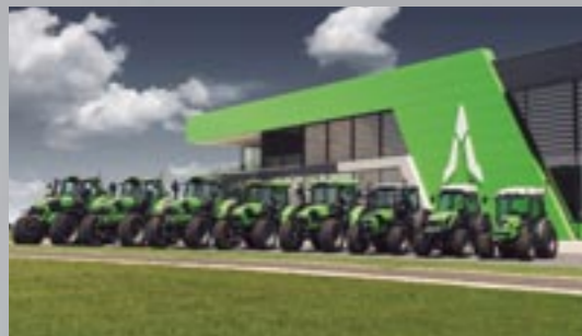
DEUTZ-FAHR Traktorenprogramm von 30 -340 PS (vor der neu errichteten DEUTZ-FAHR Arena).

Weitere Informationen finden Sie unter www.deutz-fahr.at DEUTZ