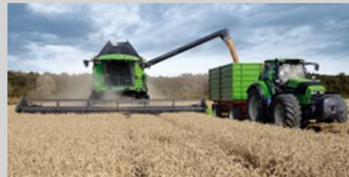
vollständiges Mähdrescher- und Traktorenprogramm