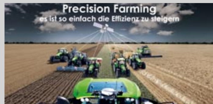
DEUTZ-FAHR Precision Farming