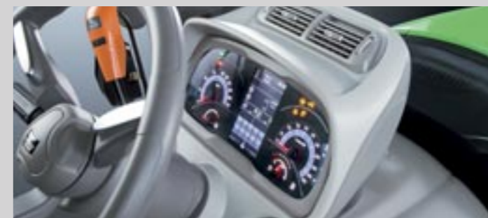
Hochmoderne Instrumententafel mit neuem InfoCentre pro . 5"-LCD Farbdisplay und hoher Auflösung für ein benutzerdefiniertes Informationskonzept auf Topniveau.