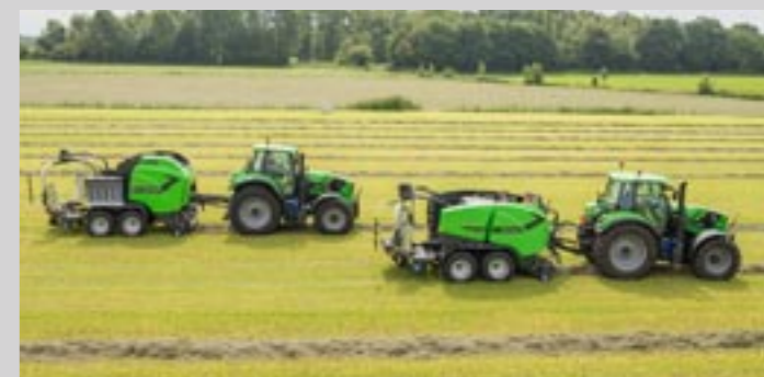
vollständiges Produktprogramm an Rundballenpressen und Press-Wickelkombinationen

JEDE FRUCHTART IST ANDERS. JEDER BODEN ETWAS BESONDERES. ABER ALLE HABEN HÖCHSTE ANSPRÜCHE AN DEUTZ-FAHR