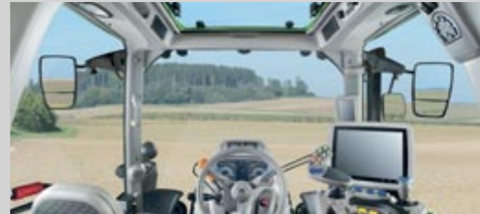
Neue Motorhaube. Optimale Sicht auf die Frontanbaugeräte. Hochwertige Materialien und Wertarbeit bis ins Detail. iMonitor ist Wunschausstattung.