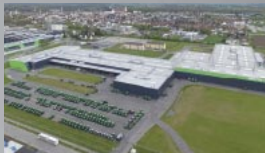
Neues DEUTZ-FAHR Traktorenwerk in Lauingen (Nähe München).