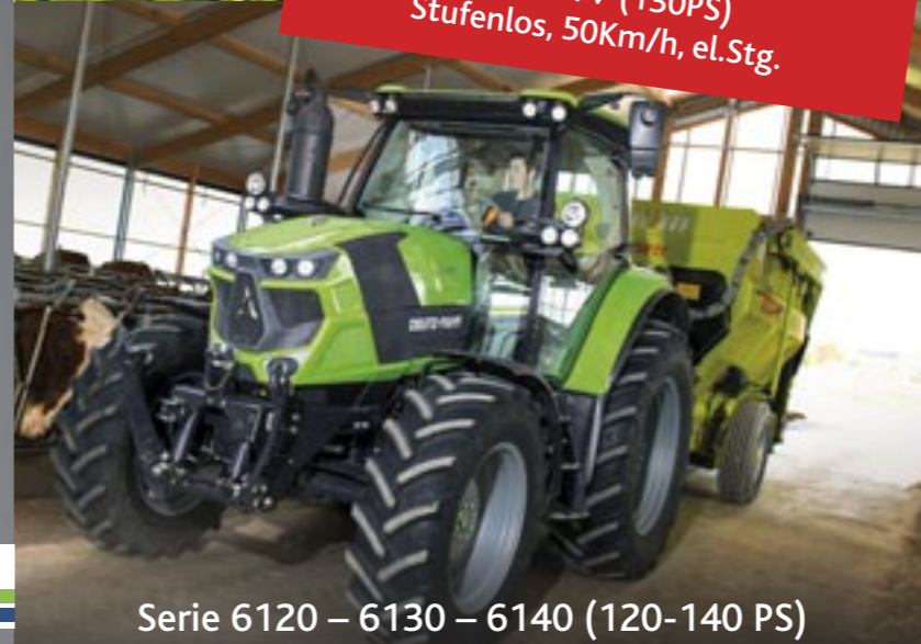
Serie 6120 – 6130 – 6140 (120-140 PS)

AKTION: 6120 (126 PS) Powershift - gefederte Vorderachse und Kabinenfederung ohne Aufpreis 6130 TTV (130PS) Stufenlos, 50Km/h, el.Stg.